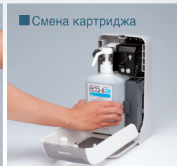
■ Смена картриджа

Антивандальный замок защищает дозатор и его содержимое от несанкционированного доступа.