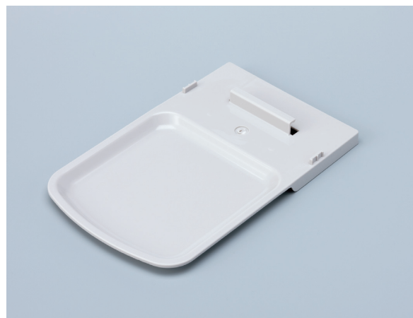
Лоток (Тип А)

Дозатор также устанавливается на вертикальную стойку. Стойку с крепежными элементами можно заказать дополнительно.