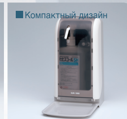
■ Компактный дизайн

Пустой картридж легко заменить на новый.