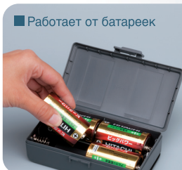
■ Работает от батареек

4-х батареек D класса хватает на 1 год использования.* * Проверено на дозаторе с жидким мылом.